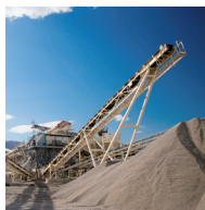
Mines et carrières