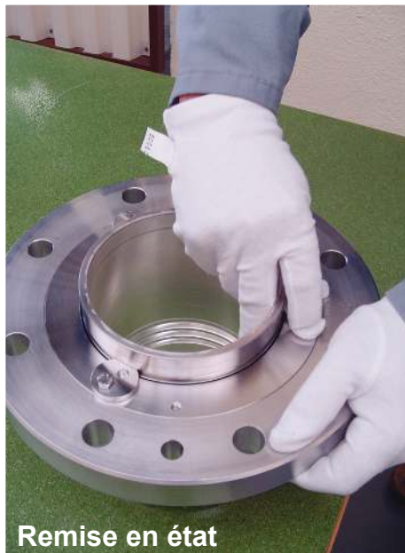
Remise en état