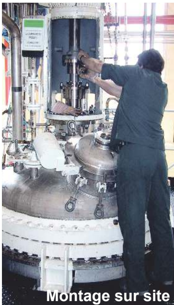
Montage sur site