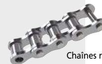
Chaînes rouleaux simple inox